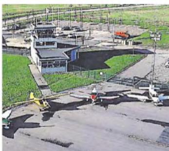
L'aérodrome d'Ancenis n'a accueilli que 175 passagers en 2015.