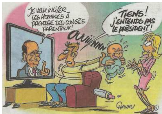
Selon Chaunu dans Ouest-France.